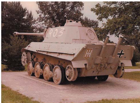
Deutlich gestiegen: die Rüstungsausgaben in Deutschland!

Wer Konflikte lösen und ihre Ursachen bekämpfen will, der muss mit der Abrüstung der eigenen Bedrohungspotentiale beginnen, dazu gehört auch der Abzug der Nuklearwaffen, die immer noch in Deutschland lagern. Rüstungskontrolle und Abrüstung müssen in Deutschland und der Europäischen Union beginnen, nur so kann glaubwürdiger Druck für die Abrüstung anderer Militärmächte erzeugt werden.