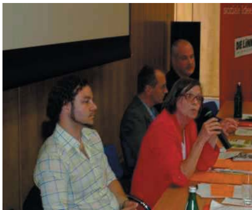
Podium der Energiekonferenz: mit dabei: Attac, Bundestagsfraktion DIE LINKE, BUND und Landesvorstand NRW DIE LINKE

Unbestritten ist, dass die Zukunft einer sozialen und ökologischen Energieversorgung in einem Ausstieg aus Atom und Kohle liegt. NRW ist nicht nur Energieland Nr.1 es ist auch Miefmacher Nr.1 in Bezug auf den CO2 Ausstoß. Und das nicht wegen der Größe des Landes, sondern einer Energiepolitik, die an den Interessen der großen Vier, insbesondere des RWE orientiert. So ist z.B. im Bundesdurchschnitt der Anteil Strom aus erneuerbaren Energien 10% in NRW 4,8%. Nach wie vor setzen Landesregierung und Energiekonzerne auf den Neubau von Kohlekraftwerken. Das wird den CO2 Ausstoß vergrößern, statt zu verringern. Diese Energiepolitik kostet Beschäftigung, statt durch eine Wende zum Ausbau erneuerbaren Energien Beschäftigung zu ermöglichen. Eine Energiewende ist ökologisch und sozial lebensnotwendig, gerade in NRW. Wir werden die Diskussion auch in örtlichen Veranstaltungen und Arbeitsgruppen zu einzelnen Themen fortführen. Rekommunalisierung, demokratische Kontrolle und Sozialtarife, eine entschiedene Energiewende durch Dezentralisierung und den Ausbau von KWK und erneuerbaren Energien sind Themen, die wir auch im kommenden Kommunalwahlkampf auf die Tagesordnung setzen.