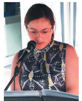
Sevim Dagdelen liest Bert Brecht

Anlässlich des 75. Jahrestages der Bücherverbrennung in Bochum hat MdB Sevim Dagdelen am 10. Juni nachmittags in der Innenstadt aus verbrannten Büchern vorgelesen. Bei der zentralen Abendveranstaltung in der Christuskirche zitierte sie auf Einladung des Bündnisses gegen Rechts vor hunderten von begeisterten ZuhörerInnen das Gedicht „An die Nachgeborenen“ von Bert Brecht.